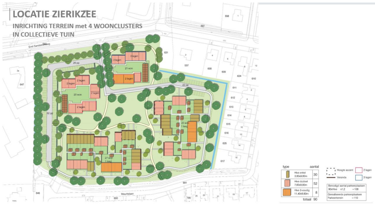
SO stedenbouwkundig en landschappelijk plan (Bron: KuiperCompagnons, 3 oktober 2023)