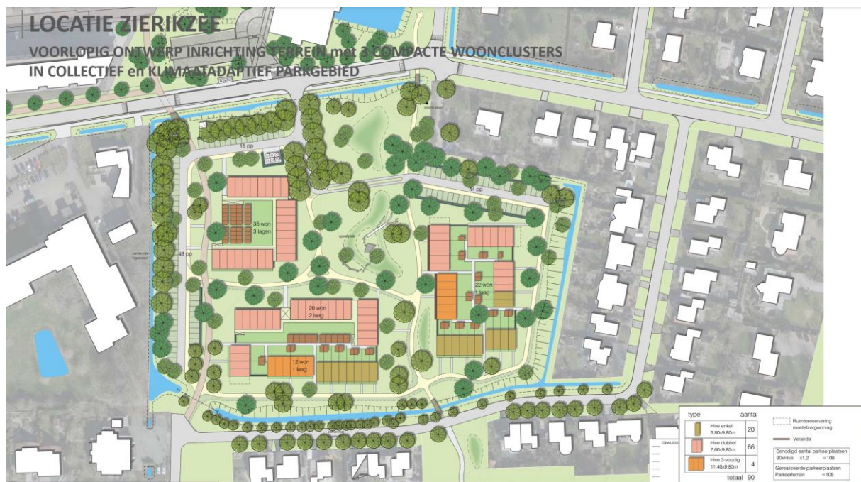
VO stedenbouwkundig en landschappelijk plan